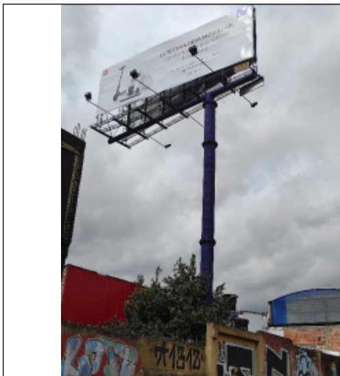
Foto 2. Vista de la estructura de la valla y del panel orientación Norte – Sur con publicidad.